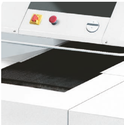
TABLE D'ALIMENTATION AVEC BANDE DE TRANSPORT

Lubrification automatique du bloc de coupe durant la destruction pour assurer un rendement régulier.