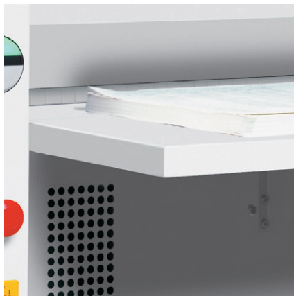
TABLE D'ALIMENTATION RABATTABLE

Utilisation intuitive : commande EASY-SWITCH avec guidage de l'utilisateur grâce à des codes couleurs et des symboles lumineux.